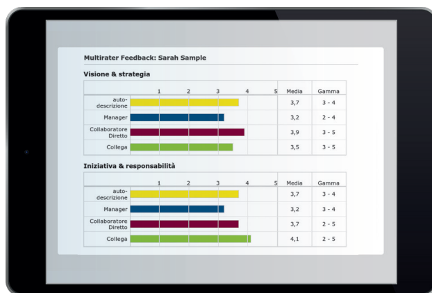
360° feedback report extract